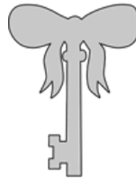
Placard des papiers cadeaux

J'ouvre le placard dans lequel sont rangés ce que l'on pourrait appeler les retardateurs de surprise.