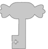
Réserve des fèves de cacao

Derrière ma porte se cachent les graines venues d'ailleurs qui permettent de fabriquer les petits délices de Noël.