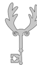
Réserve de foin

Je renferme la force secrète des porteurs de présents.